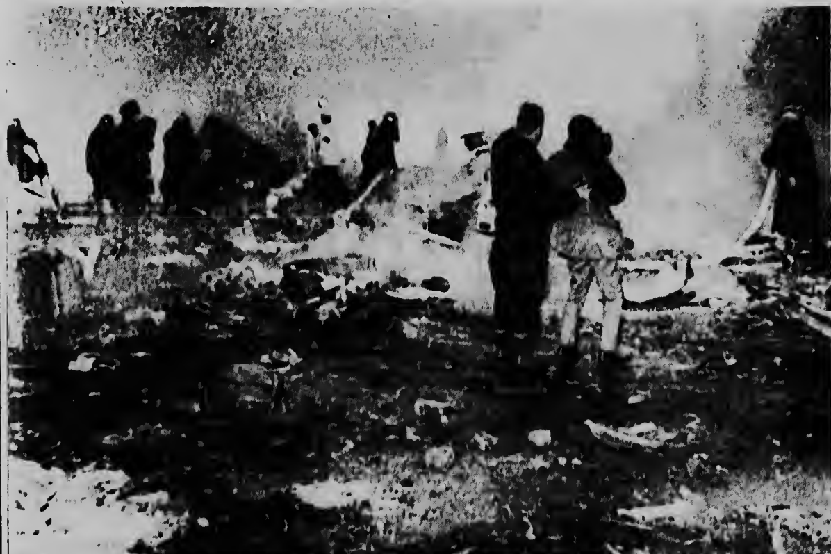
Tokio-Cuerpo di rescate y bombero ta trahando caminda un jet a cai ora e tabata trata di aterrizá. E aparato tabatin 70 persona a bordo.

Pa informacion acudi na: Jurriens-Palisiaweg 53, San Nicolas. (pegá cu Weg Seroe Blanco).